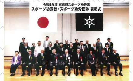
令和5年度東京都スポーツ功労表彰式 - スポーツ功労団体 - 於 東京都福祉会館多室ホール 令和5年11月2日